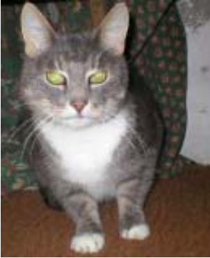
Zuhause gesucht - Tinker (FeLV positiv)