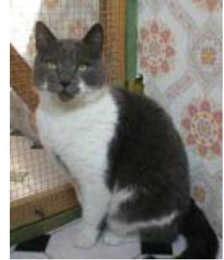
Zuhause gefunden - Purzel (FeLV positiv)

Stubentiger, die mit dem Leukosevirus infiziert sind, werden vielfach einfach abgeschoben. Sie müssen ihr Dasein einsam und unter Stress in zu kleinen Boxen fristen. Unter diesen Haltungsbedingungen kann es nicht zur notwendigen Stärkung des Immunsystems kommen. Katzenfreiheit will daher ein Domizil in Licht, Luft und Sonne für die benachteiligten Samtpfoten schaffen.