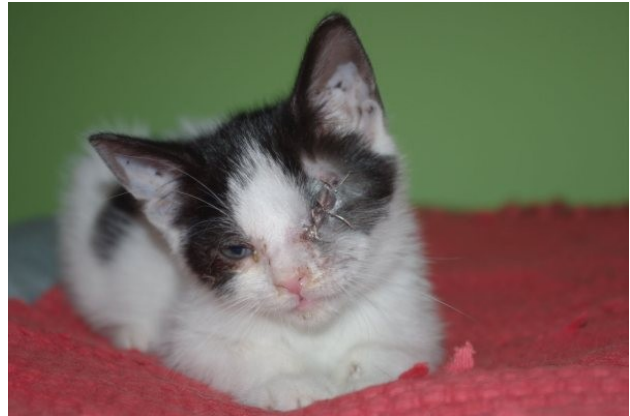
Aurelia nach OP

Als ein junger Mann auf einem abseits gelegenen Parkplatz hielt um sein Navi neu einzuspeichern, vernahm er ein klägliches Miauen. Diesem Geräusch ging der Tierfreund nach und entdeckte unter einem Abfalleimer ein winzig kleines Katzenbaby. Der mitleidige Mann nahm das ausgesetzte Tierbaby mit nach Hause und besorgte sich Aufzuchtsmilch. Aber leider war es ihm aus beruflichen Gründen nicht möglich, den Welpen alle zwei Stunden mit Milch zu versorgen.