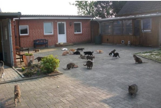
Einige unserer Freigänger

Alle Freigängerkatzen, für die unser Tierheim die meist endgültige Bleibe darstellt, freuen sich über Katzenfutter und Hilfe für die Entflohung und Entwurmung durch Spot on - Mittel.